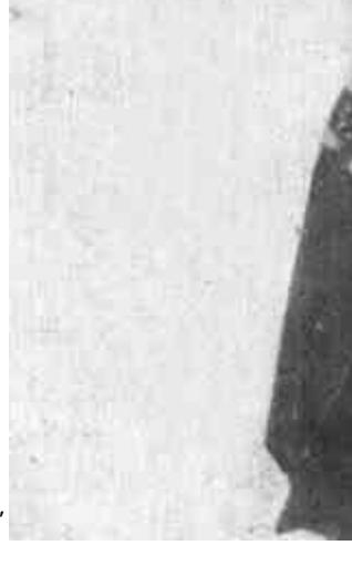
风雪交警

一是狠刹公款吃喝玩乐不正之风。在前阶段工作的基础上加大工作力度,从严执纪,防止节日期间公款吃喝玩乐再度回潮。