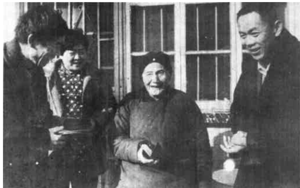
春节前夕，东营区牛庄镇及时为全镇830余名孤寡老人颁发了优待证。