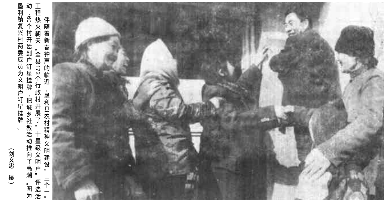
伴随着新春钟声的临近，垦利县农村精神文明建设“三个一”工程火热朝天。全县22个行政村开展了“十星级文明户”评选活动，20个村开始到户挂牌，把城乡社区教活动推向了高潮。图为垦利镇复兴村两委会成员为文明户挂牌。